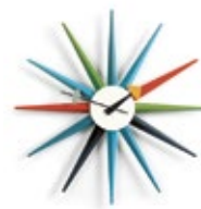
Sunburst Clock, mehrfarbig, Ø 470