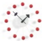
Ball Clock, rot, Ø 330