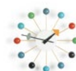
Ball Clock, mehrfarbig, Ø 330