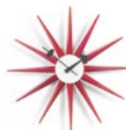
Sunburst Clock, rot, Ø 470