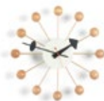
Ball Clock, Buche, Ø 330