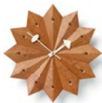
Fan Clock, Kirschbaum (USA), Ø 384