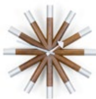
Wheel Clock, Nussbaum/Aluminium, Ø 455