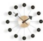
Ball Clock, schwarz/Messing, Ø 330