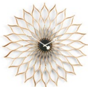
Sunflower Clock, bouleau, Ø 750