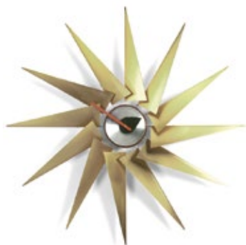
Turbine Clock, laiton/aluminium, Ø 765