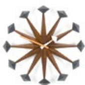
Polygon Clock, noyer, Ø 430