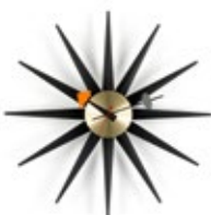
Sunburst Clock, noir/laiton, Ø 470