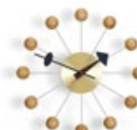
Ball Clock, cerisier, Ø 330