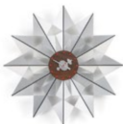
Flock of Butterflies, aluminium, Ø 610